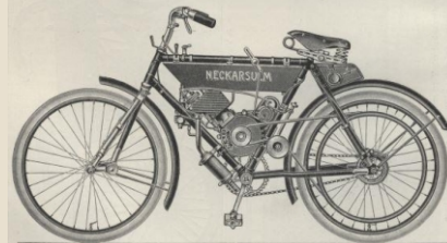
3. Leichtes Motorzeirad.